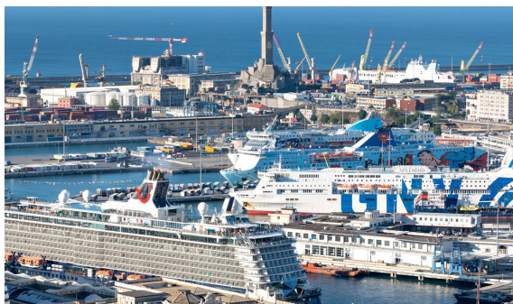
La Redazione |