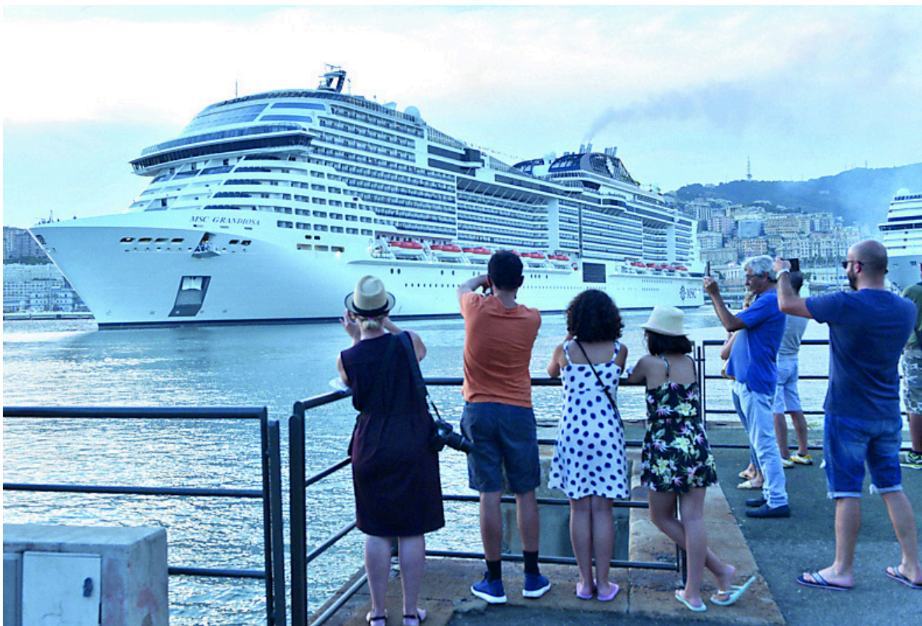
Un gruppo di crocieristi nel porto di Genova